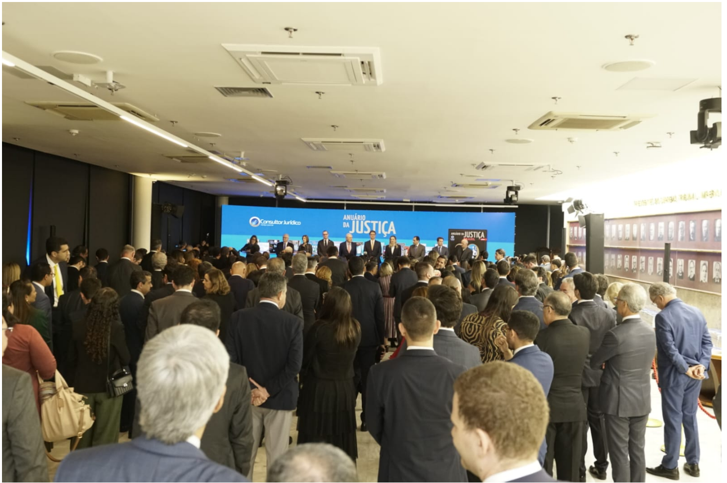
Edson Fachin, Maria Elizabeth Rocha, Herman Benjamin e Gilmar Mendes