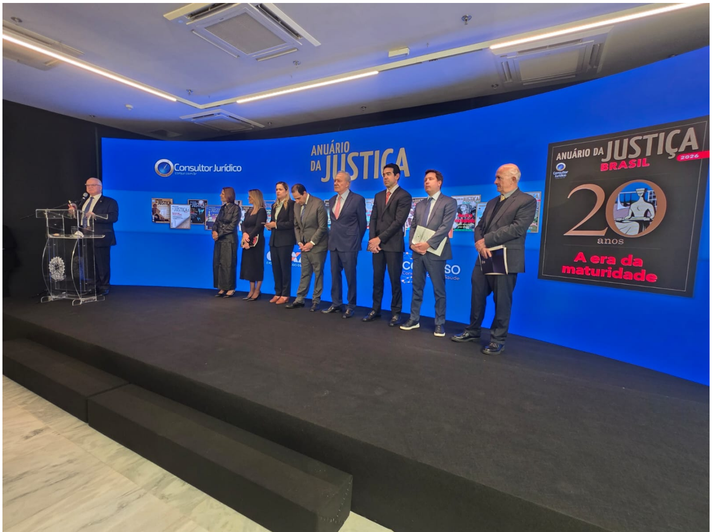
Edson Fachin discursa no evento de lançamento