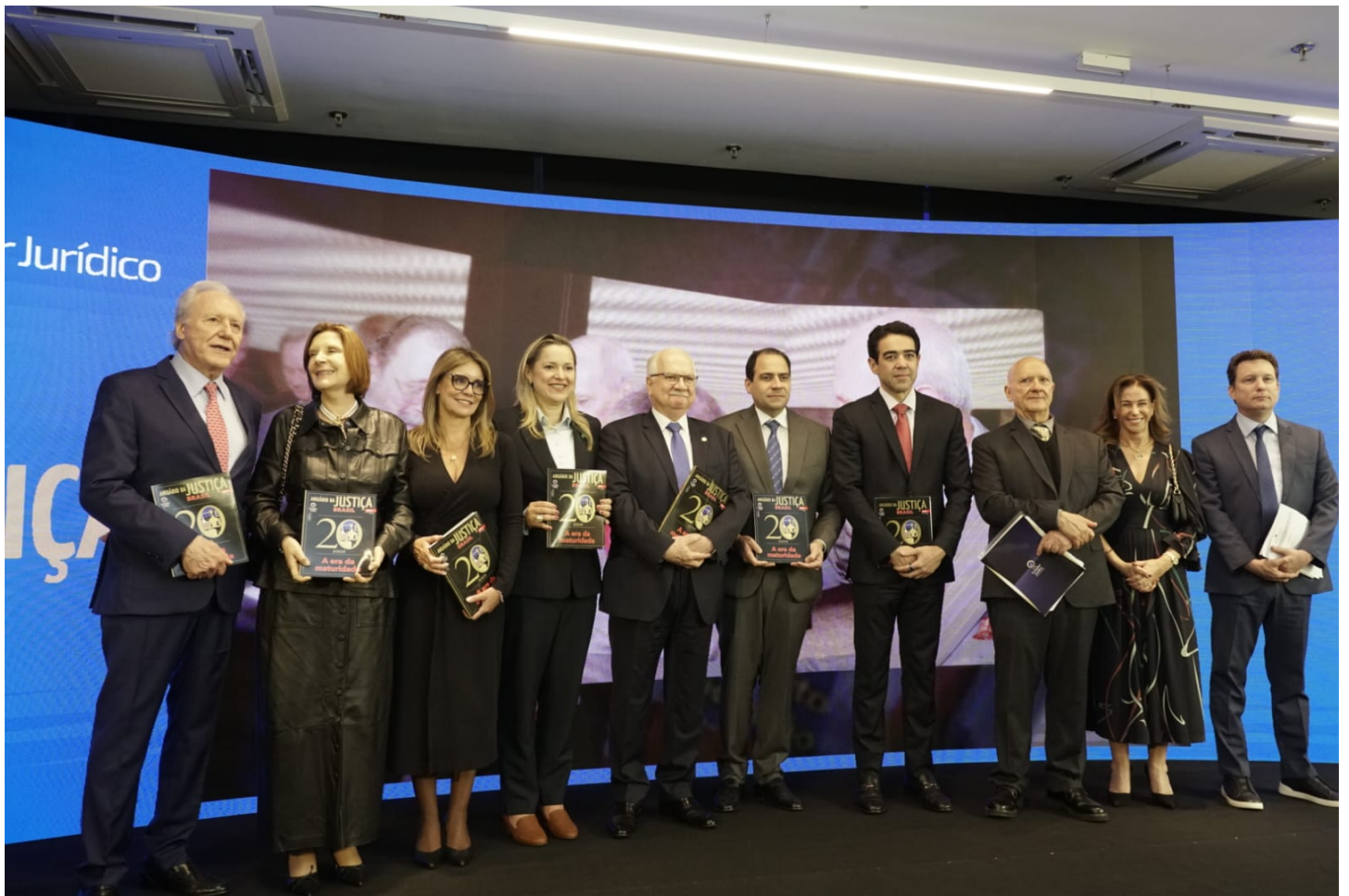
Dispositivo do evento de lançamento reuniu autoridades do Judiciário brasileiro ConJur