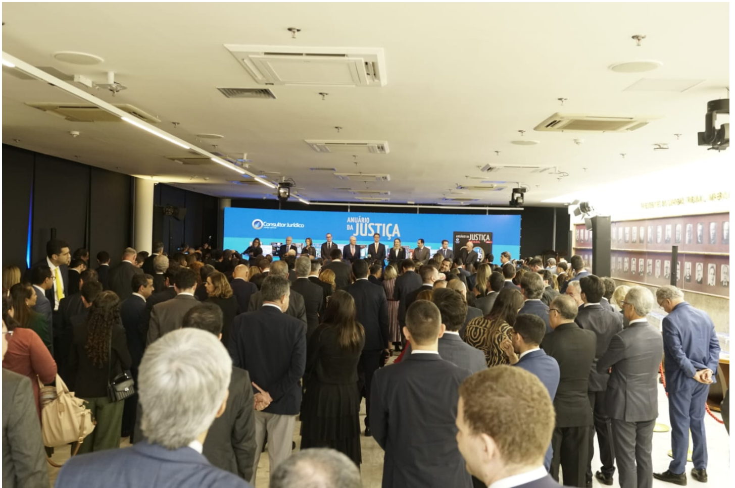
Salão Branco do STF ficou lotado no evento de lançamento ConJur