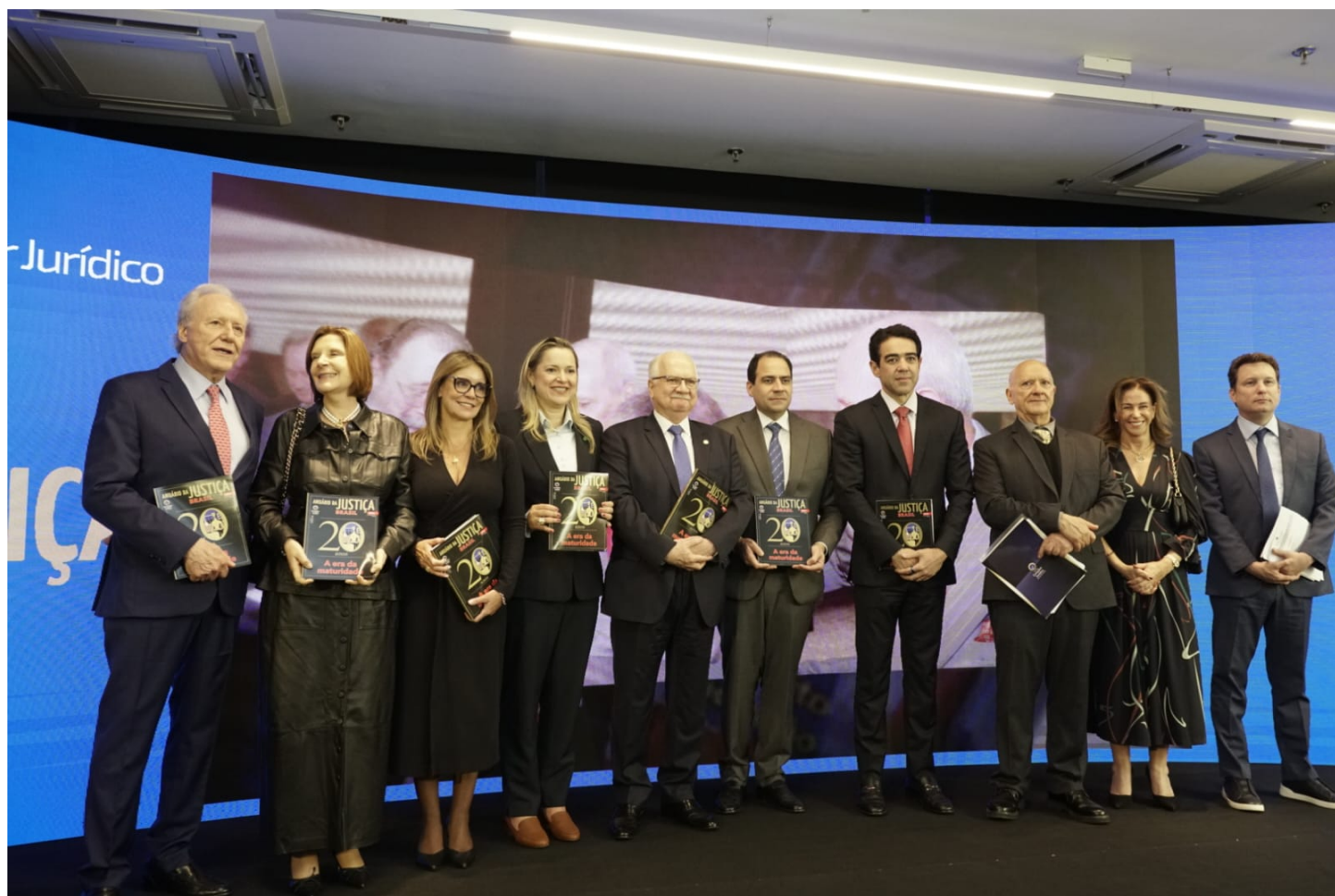
Dispositivo do evento de lançamento reuniu autoridades do Judiciário brasileiro ConJur