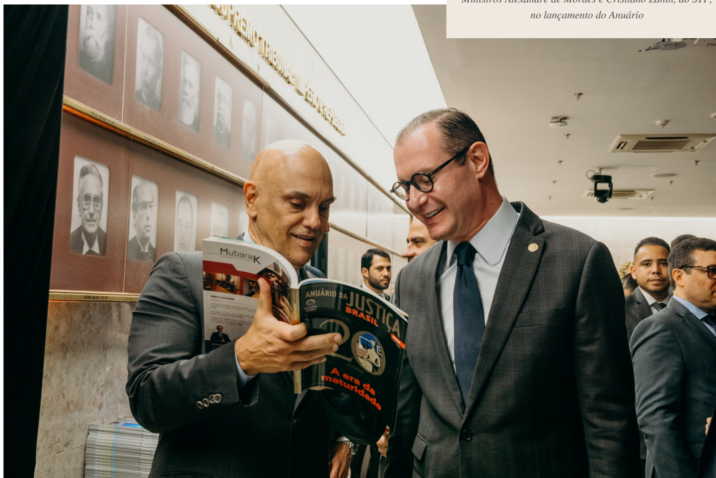
Ministros Alexandre de Moraes e Cristiano Zanin, do STF, no lançamento do Anuário

Ministros Alexandre de Moraes e Cristiano Zanin, do STF, no lançamento do Anuário