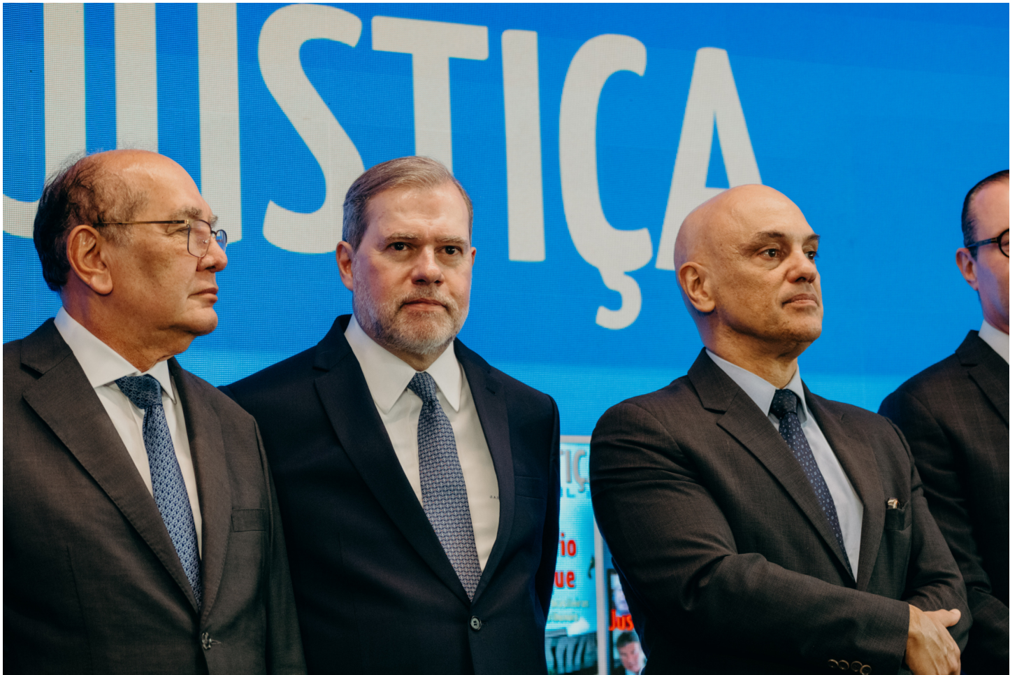
Ministros Gilmar Mendes, Dias Toffoli e Alexandre de Moraes no dispositivo de honra