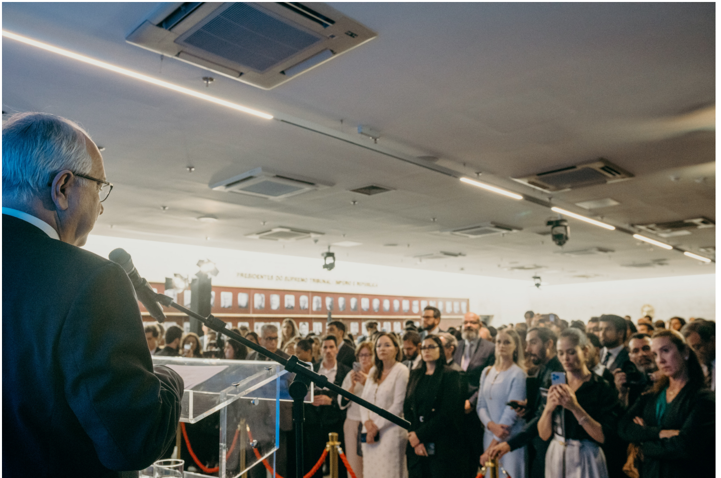
Convidados acompanham o discurso do ministro Edson Fachin