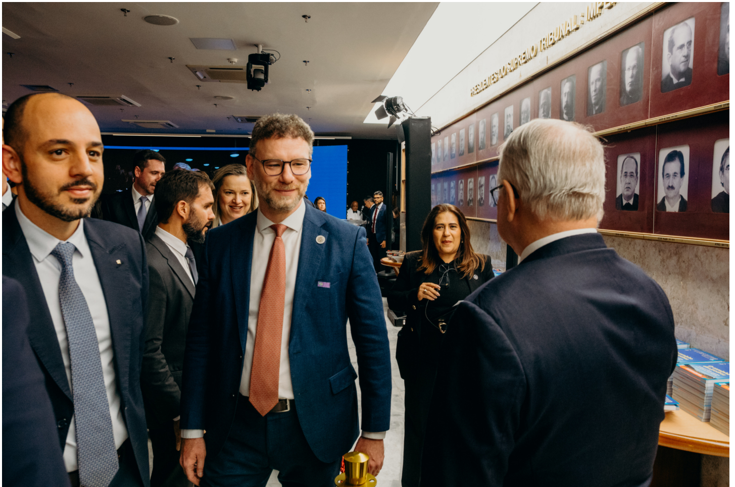
Ilan Presser, juiz federal e conselheiro do CNJ