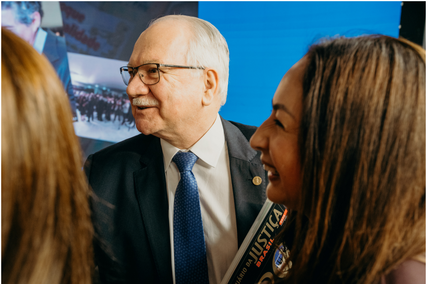
Edson Fachin