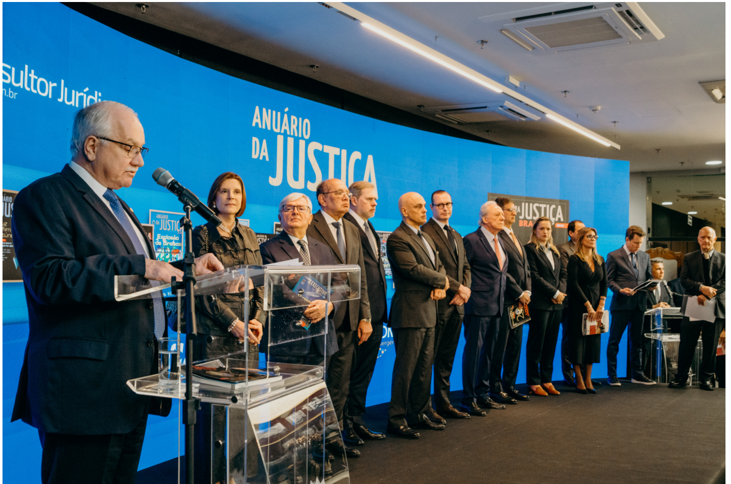
Presidente do STF, Edson Fachin, discurso no lançamento do Anuário da Justiça Brasil 2026