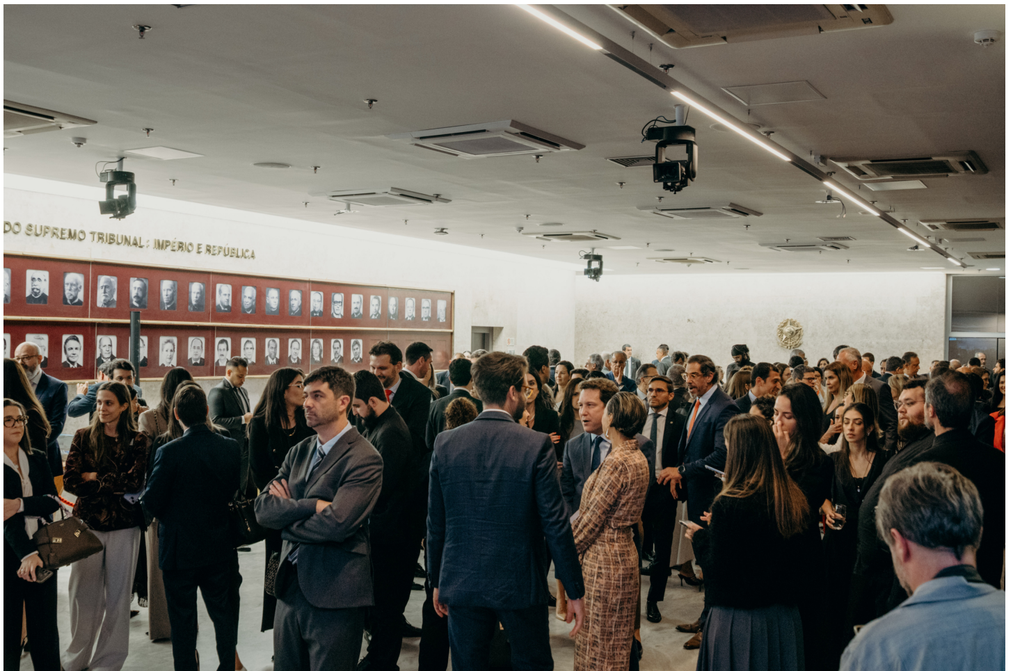
Vista geral: lançamento do Anuário da Justiça Brasil no Salão Branco do STF