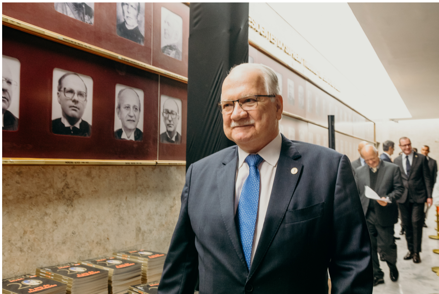
Edson Fachin, presidente do STF, chega ao lançamento do Anuário da Justiça