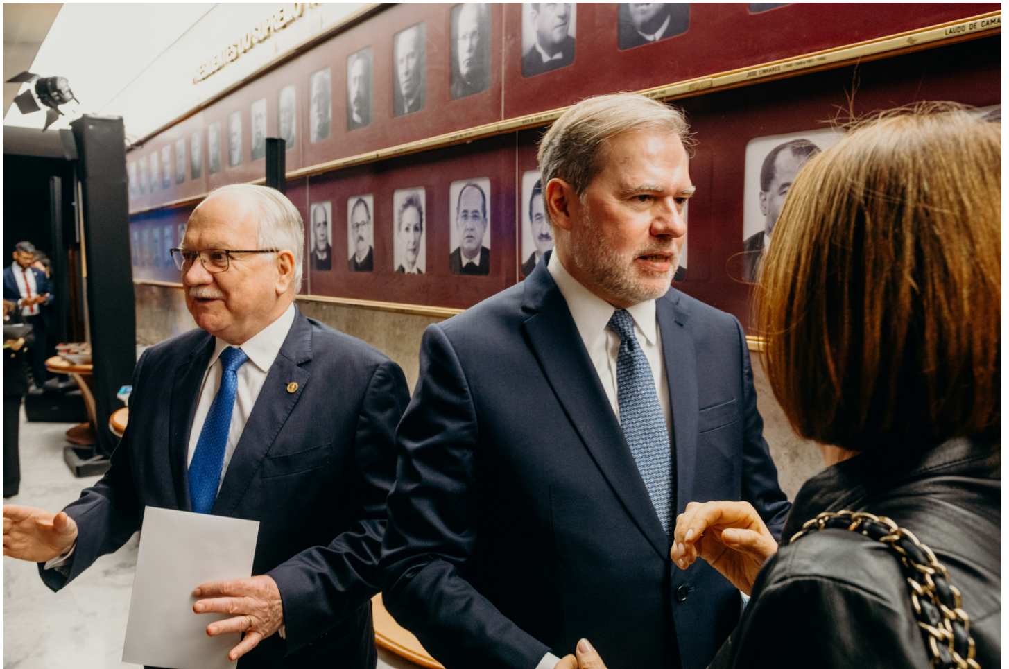
Ministros do STF, Edson Fachin e Dias Toffoli