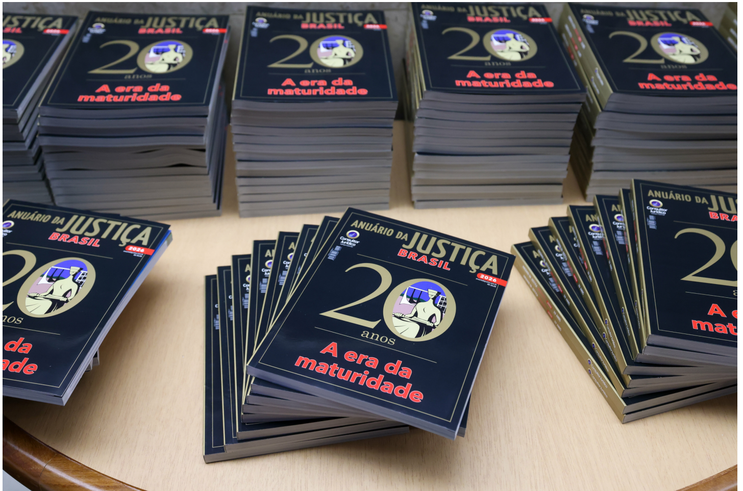
Lançamento da edição 20 anos do Anuário da Justiça Brasil Gustavo Moreno/STF