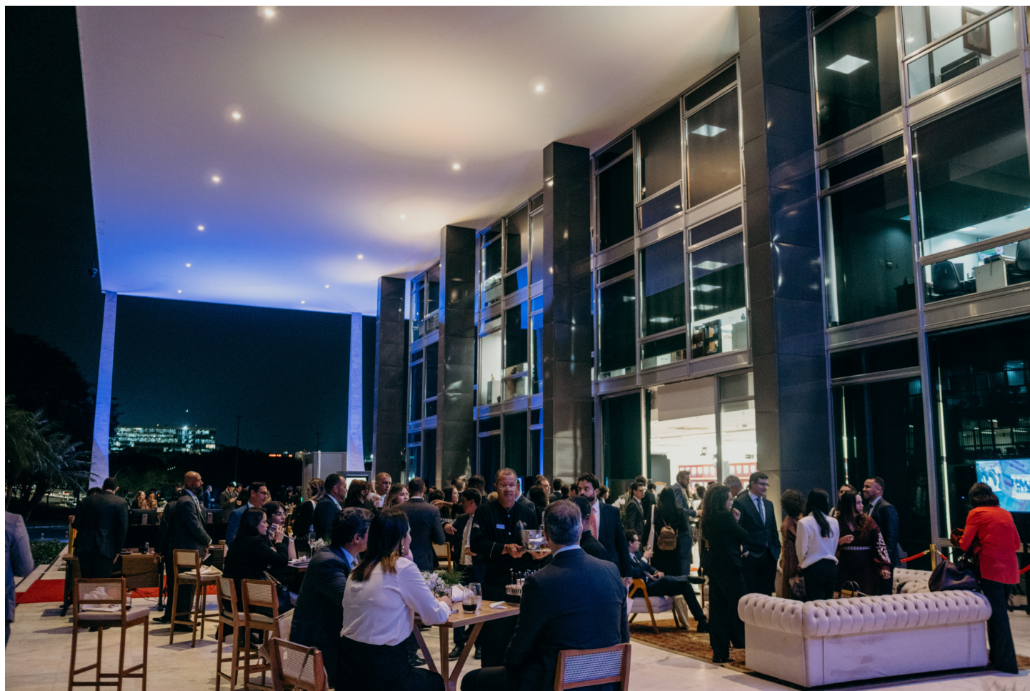
Evento de lançamento do Anuário da Justiça Brasil 20 anos