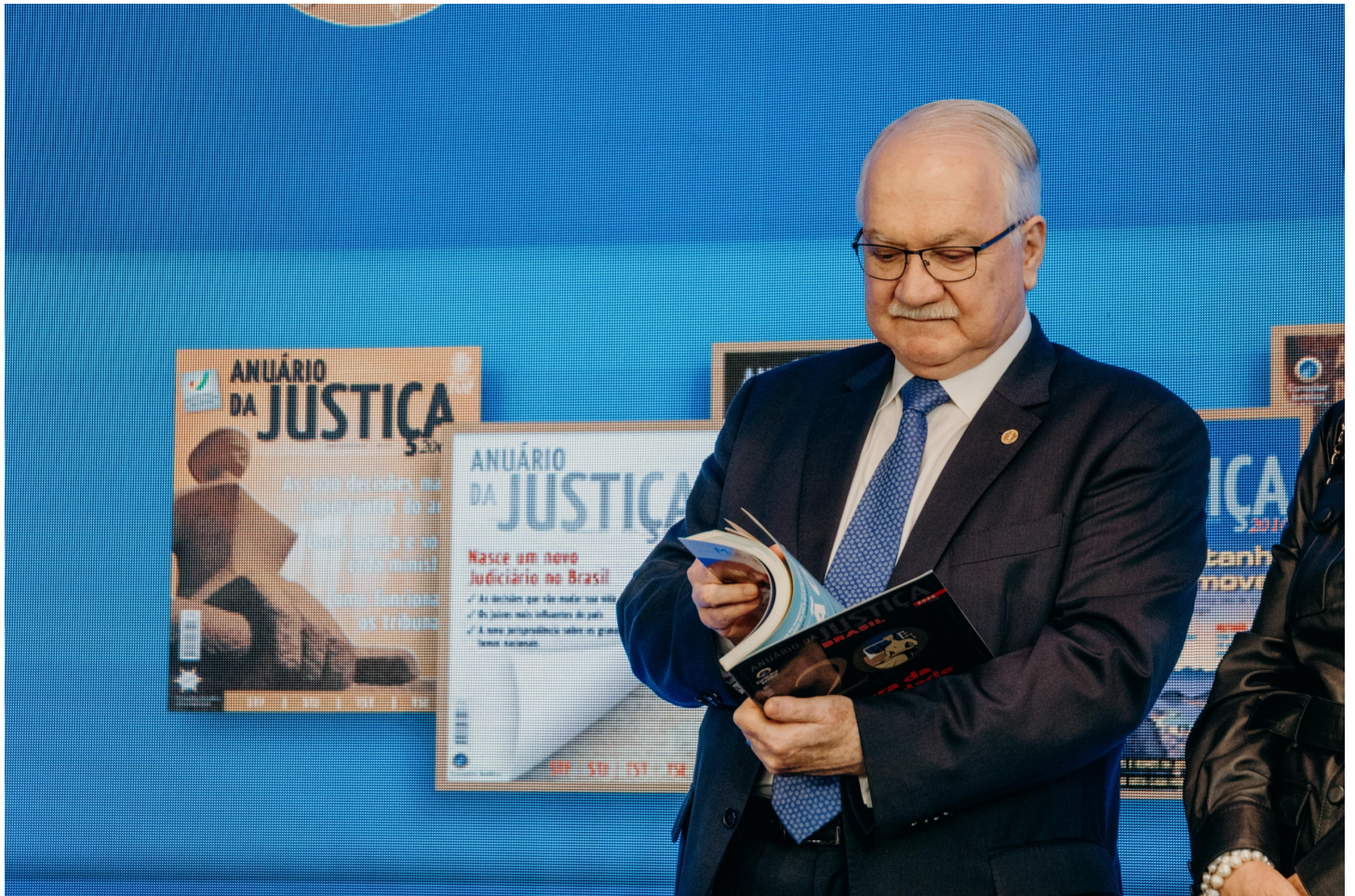
Edson Fachin folheia a nova edição do Anuário da Justiça Brasil