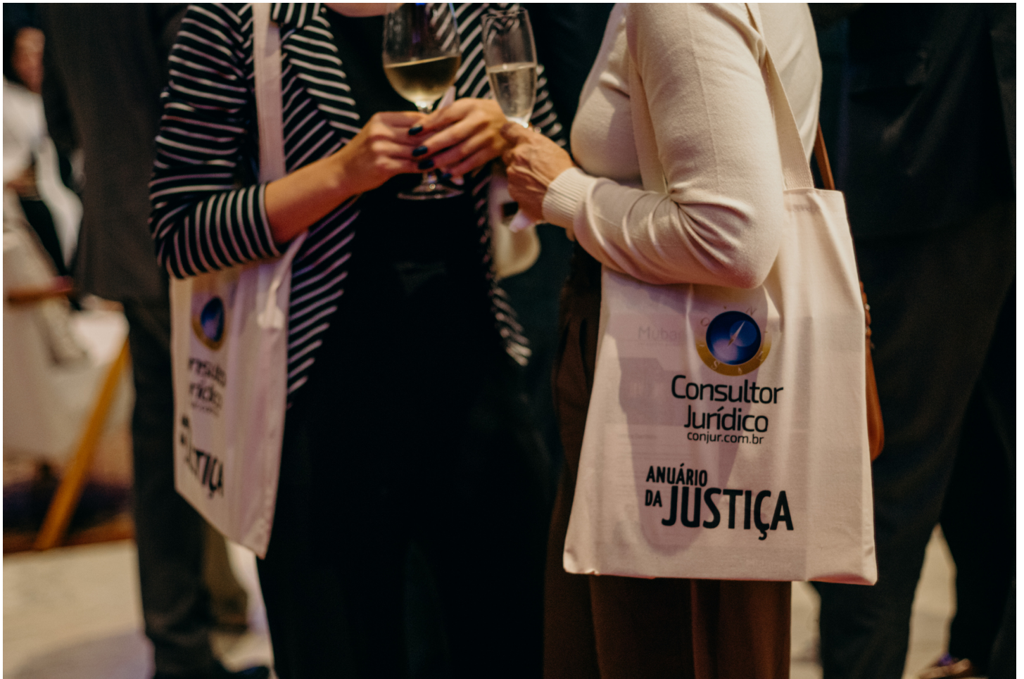
Lançamento do Anuário da Justiça Brasil 2026