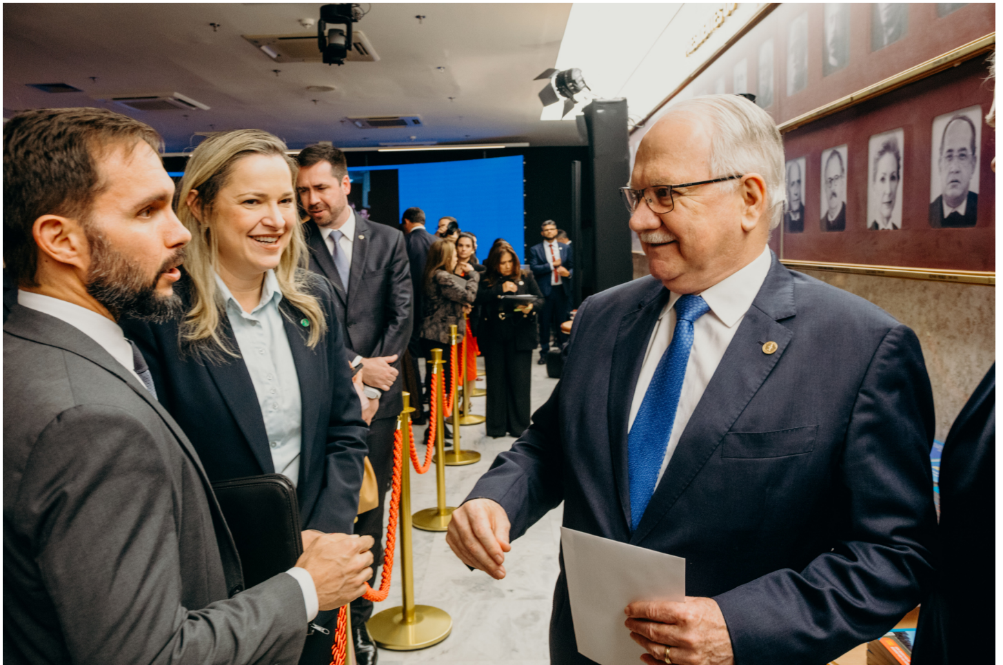
Edson Fachin, presidente do STF