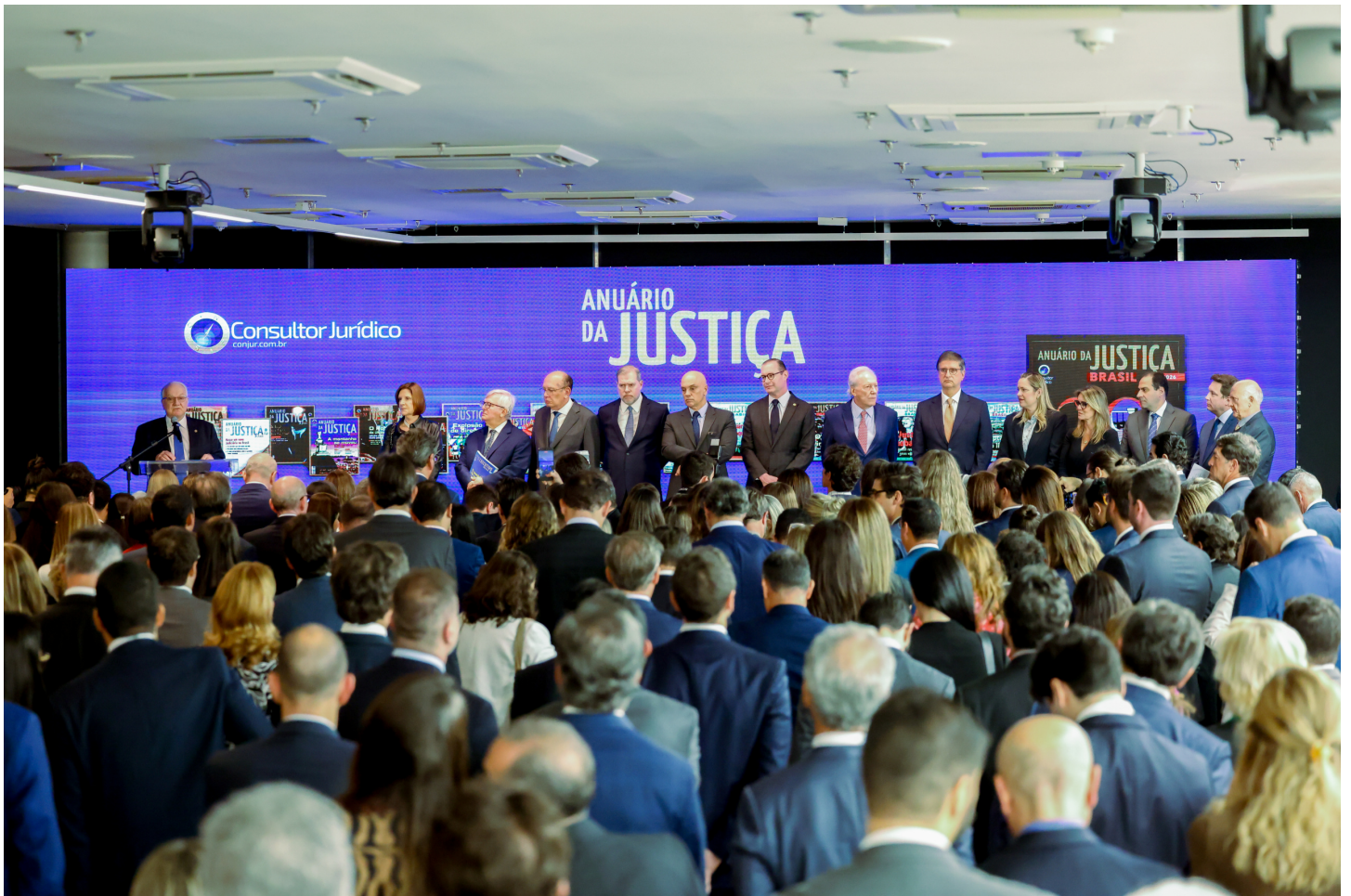
Edson Fachin e o dispositivo de honra no lançamento do Anuário da Justiça Brasil 2026

Anuário da Justiça Saúde Suplementar, 2ª edição