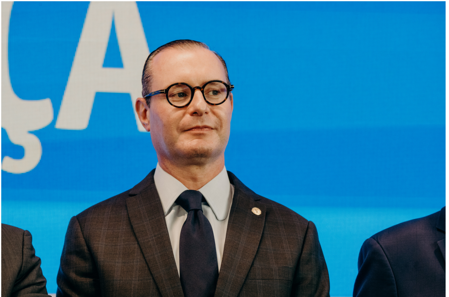
Ministro Cristiano Zanin, do STF