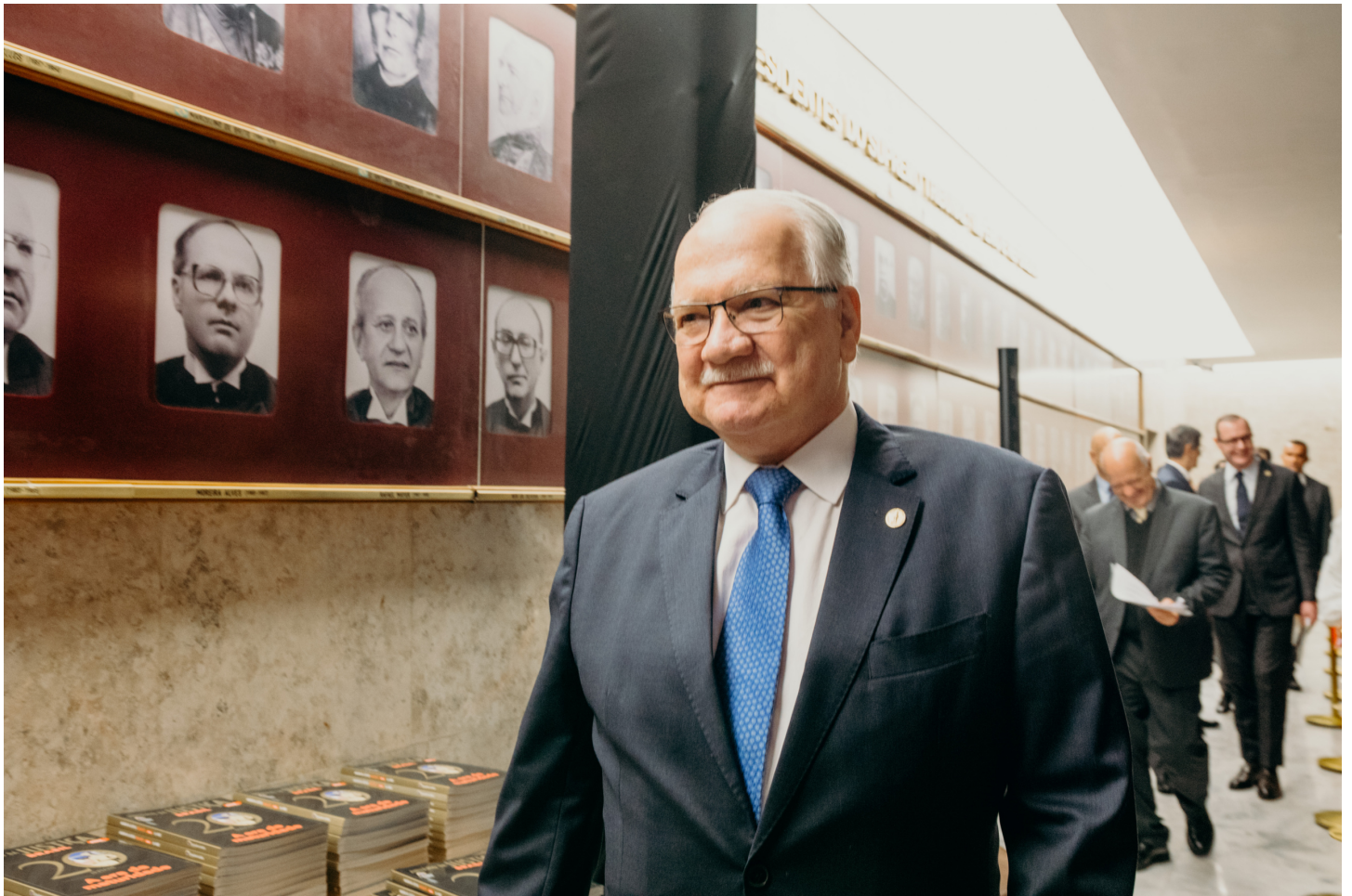
Edson Fachin, presidente do STF, chega ao lançamento do Anuário da Justiça