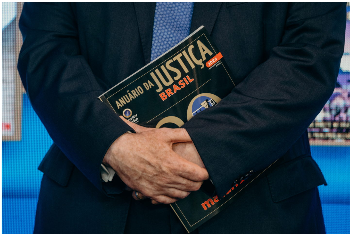
Lançamento do Anuário da Justiça Brasil 2026 no STF