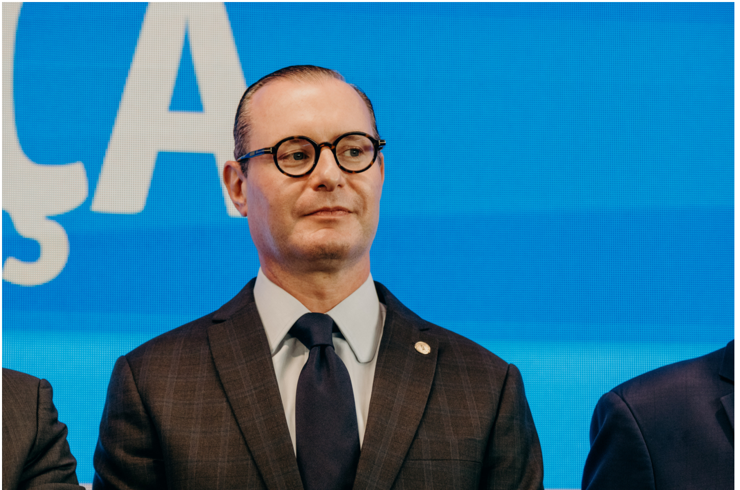
Ministro Cristiano Zanin, do STF