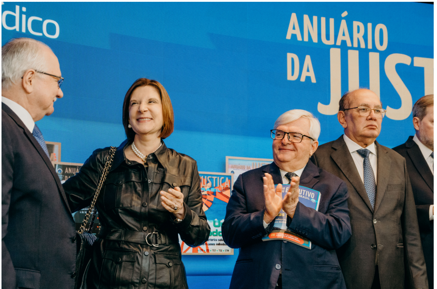
Edson Fachin é aplaudido depois de seu discurso