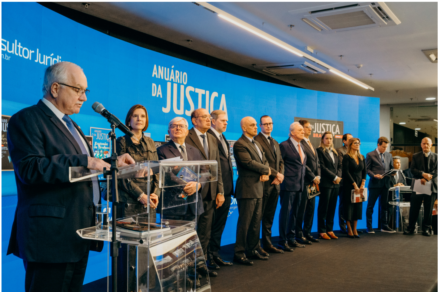
Presidente do STF, Edson Fachin, discurso no lançamento do Anuário da Justiça Brasil 2026