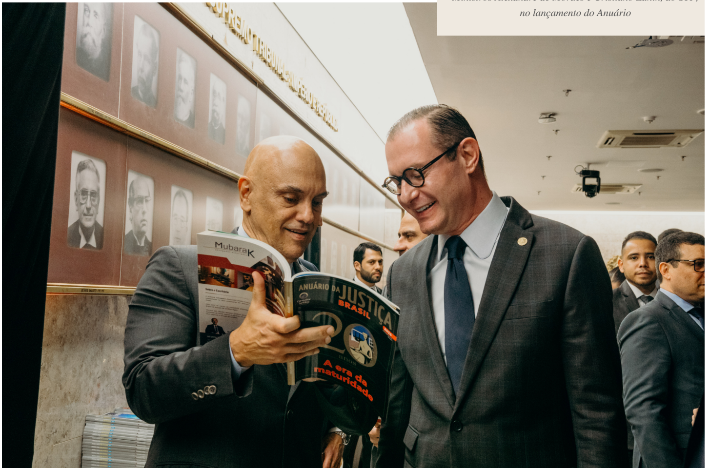
Ministros Alexandre de Moraes e Cristiano Zanin, do STF, no lançamento do Anuário

Ministros Alexandre de Moraes e Cristiano Zanin, do STF, no lançamento do Anuário Paula Carrubba/Anuário da Justiça