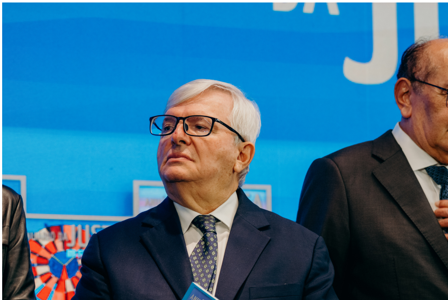
Presidente do STJ, Herman Benjamin, no dispositivo de honra