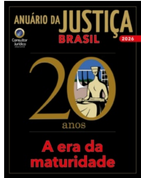
Capa do Anuário da Justiça Brasil — Especial 20 anos

Antes mesmo de se tornar ministro do STF, Gilmar Mendes já era um influenciador (no bom sentido) do Judiciário. Na Subchefia para Assuntos Jurídicos da Casa Civil (1996-2000) no governo FHC, foi responsável pela tramitação da Lei das