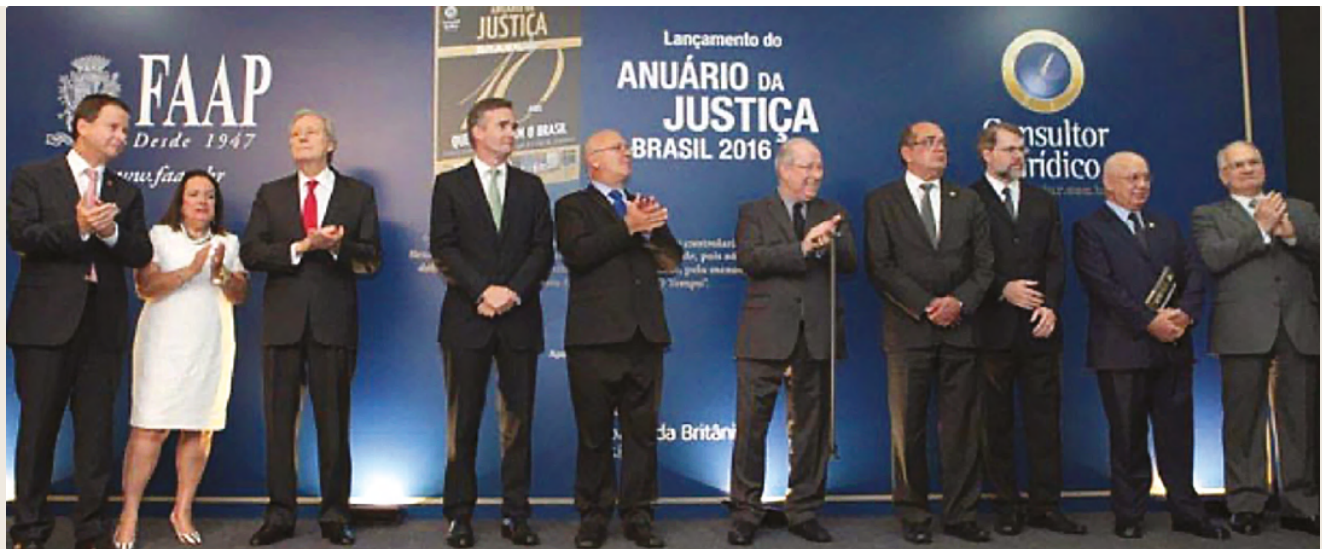
Anu rio 2016: com Ricardo Lewandowski na Presid ncia, a celebra  o da 10  edic o

Desde ent o, tanto a ConJur como o Anu rio acompanharam os grandes esc ndalos da pol tica nacional com um vi s t cnico e jur dico, diferenciando o tom de sua cobertura da gritaria e do espet culo que marcou politicamente as reportagens da grande m dia. Isto ficou mais claro do que nunca na cobertura dos processos resultantes de duas opera es da Pol cia Federal: a satyagraha, a partir de 2008, e a “lava jato”, depois de 2014.