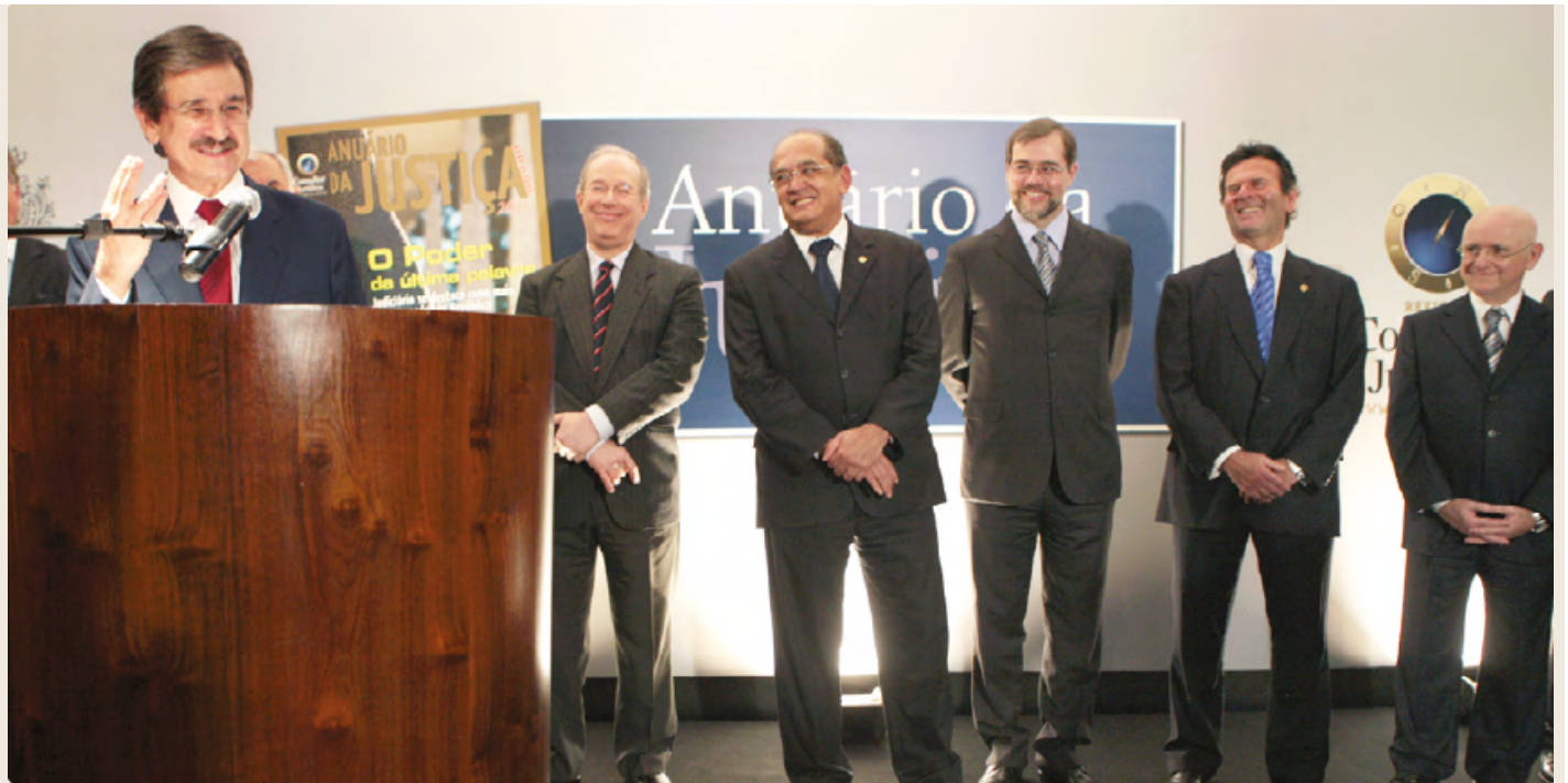
Anuário 2011 (5ª edição), dia 31 de março: Cezar Peluso é o presidente do STF

São já 86 exemplares de 13 diferentes linhagens, sem contar alguns filhos únicos, que vão, devagar e quase sempre, compondo a história do Judiciário Brasileiro. E que história. Na festa de lançamento do primeiro Anuário , o discurso de saudação da nova publicação foi feito pela presidente do Supremo, ministra Ellen Gracie. Dos dez ministros que marcaram presença no evento, apenas dois ainda estão na ativa: Gilmar Mendes e Cármen Lúcia.