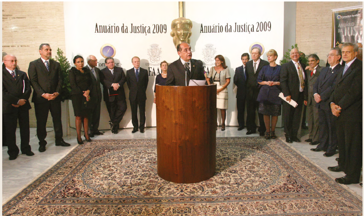
Anuário 2009 (3ª edição), dia 6 de maio: Gilmar Mendes é o presidente do STF

Mas o problema maior não foi enfrentar o monstro gigantesco, e sim penetrar em suas entranhas e expô-las publicamente. Fiando-se em suas supostas raízes quatrocentonas, o TJ-SP era então uma autêntica torre de marfim, praticamente impenetrável para o público leigo. Resumindo o caso, o presidente do tribunal na ocasião, Roberto Vallim Belocchi, baixou portaria recomendando os desembargadores da casa a não receber e não conceder entrevista aos repórteres do Anuário . Como ele recomendou e não proibiu, a publicação acabou saindo com a colaboração de boa parte dos magistrados da casa. E, firme e forte, atingiu a sua 14ª edição em 2025.