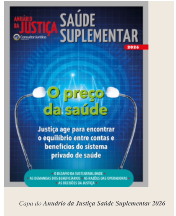
Capa do Anuário da Justiça Saúde Suplementar 2026