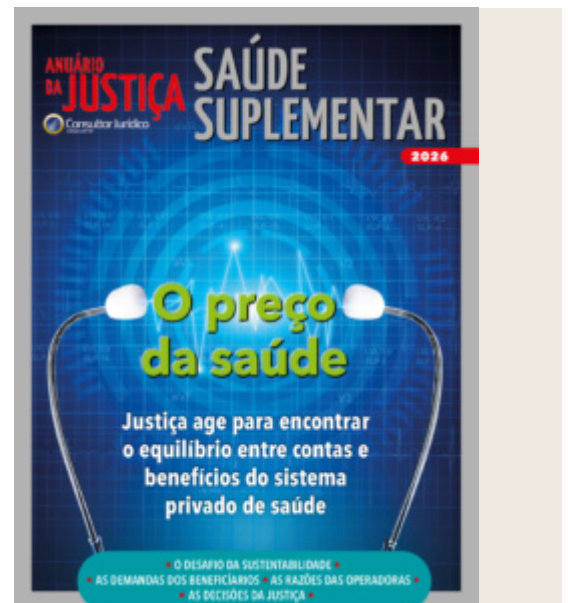
Capa do Anuário da Justiça Saúde Suplementar 2026

Pedidos de cobertura de órteses e próteses também são recorrentes. Consideradas insumos, as próteses são equipamentos para suprir ausências de membros, em casos de amputações; as órteses são equipamentos temporários para ajustes do corpo.